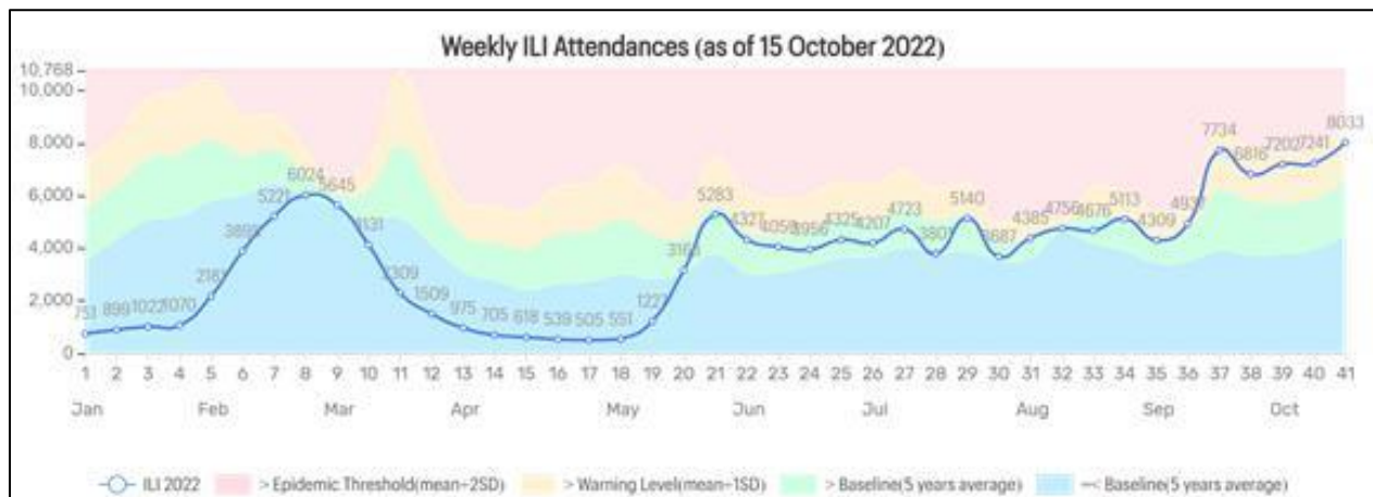
Tren ILI dari minggu 1 hingga minggu 41

lalu ialah sebanyak 8033 kes. Jumlah ini melebihi jumlah kes pada bulan Februari hingga Mac dan Jun hingga Julai pada tahun ini iaitu di antara 5,000-6,000 kes seminggu. Orang ramai adalah diingatkan untuk terus berwaspada dan mengambil langkah-langkah pencegahan seperti mengasingkan diri jika mengalami tanda-tanda jangkitan dan mengelakkan dari tempat-tempat yang penuh sesak. Segera berjumpa doktor jika tanda-tanda jangkitan berterusan atau semakin teruk. Dapatkan suntikan Influenza , khususnya bagi mereka yang berumur 60 tahun ke atas dan mereka yang mempunyai masalah-masalah kesihatan.